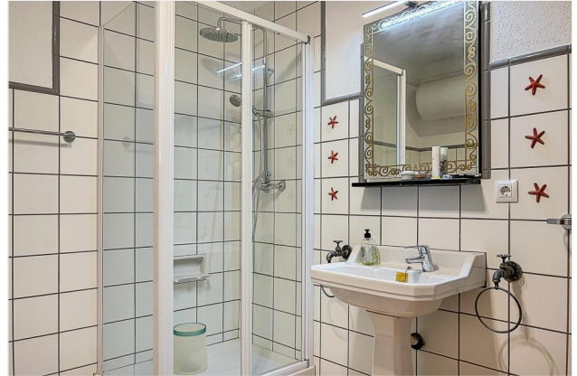
...Bad en Suite und...