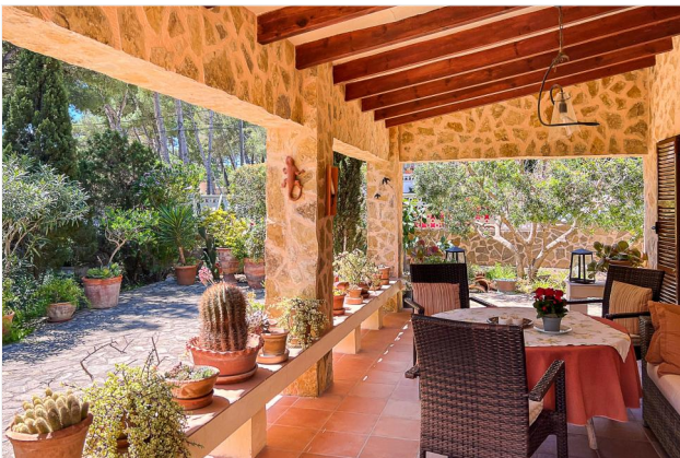
...Zugang zum Freisitz